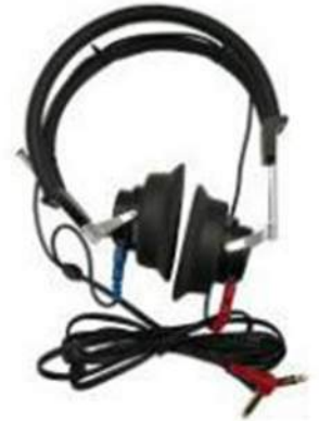
CASQUE TDH 39