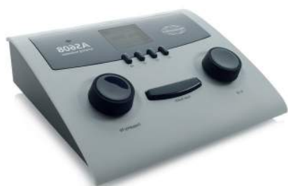
AS 608 (E)

L'audiomètre AS 608 de faible encombrement et portable est idéal pour la pratique des tests audiométriques de dépistage. Facile à utiliser, ils offrent plusieurs types de stimulations (sons purs et wobulés). L'appareil est livré avec casque anti-bruits, une sacoche de transport et un lot de piles.