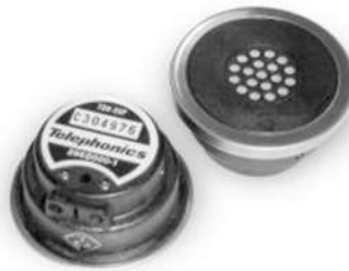
ECOUTEURS TDH 39