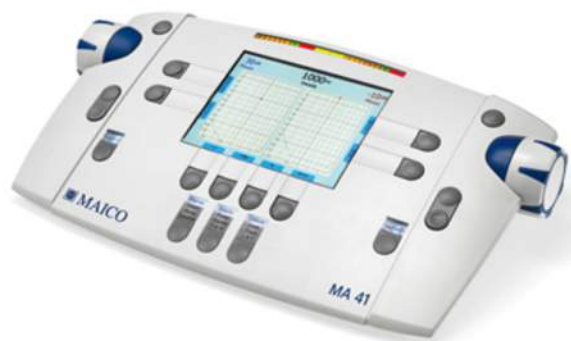
MA 41 LIGHT

Le MA 41 light est un nouvel audiomètre de la gamme MAICO.