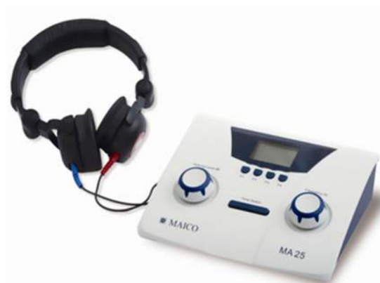
MA 25 (E)

Le MA 25 E inclus le test Hughson Westlake.