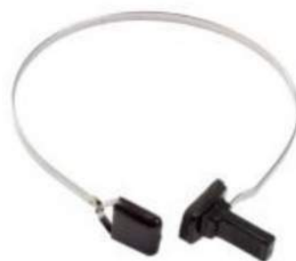
SERRE TETE VIBRATEUR